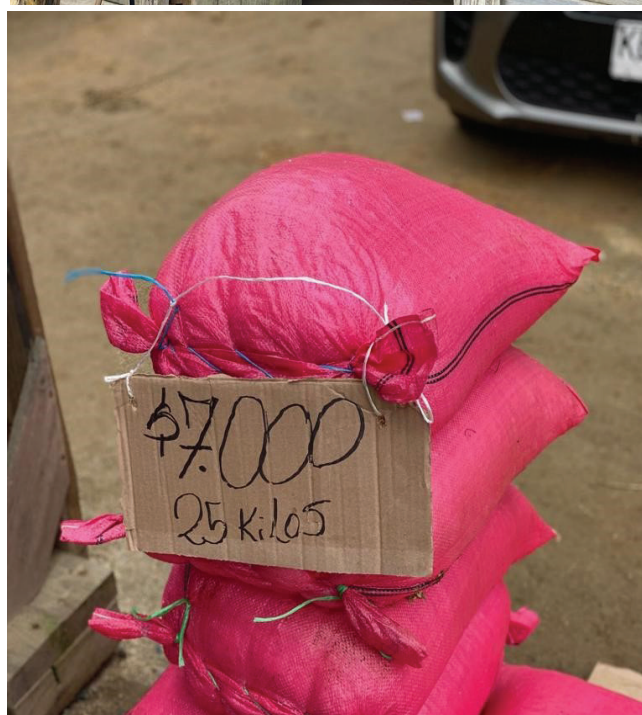
Figura 5.- Local comercial menor donde se comercializa sal en distintos formatos, como ejemplo del modelo de negocio principal de la sal de Cáhuil, asociado a la relación directa de los productores con el comprador.