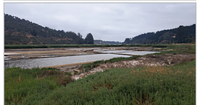
Figura 2.- Composición fotográfica de las salinas en período productivo.