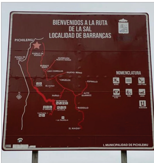
Figura 3.- Señalización de la Ruta de la Sal, parte de los programas de turismo de la zona.

Esta denominación reconoce a grupos o individuos que sirven de portadores y transmisores de tradiciones y conocimientos ancestrales fundamentales para la cultura e identidad de ellos y de la nación. Su declaración plantea el reconocimiento y fortalecimiento de estas figuras, dando un marco de apoyo para evitar la extinción de saberes en favor de la preservación y valorización (Consejo Nacional de la Cultura y las Artes 2012).