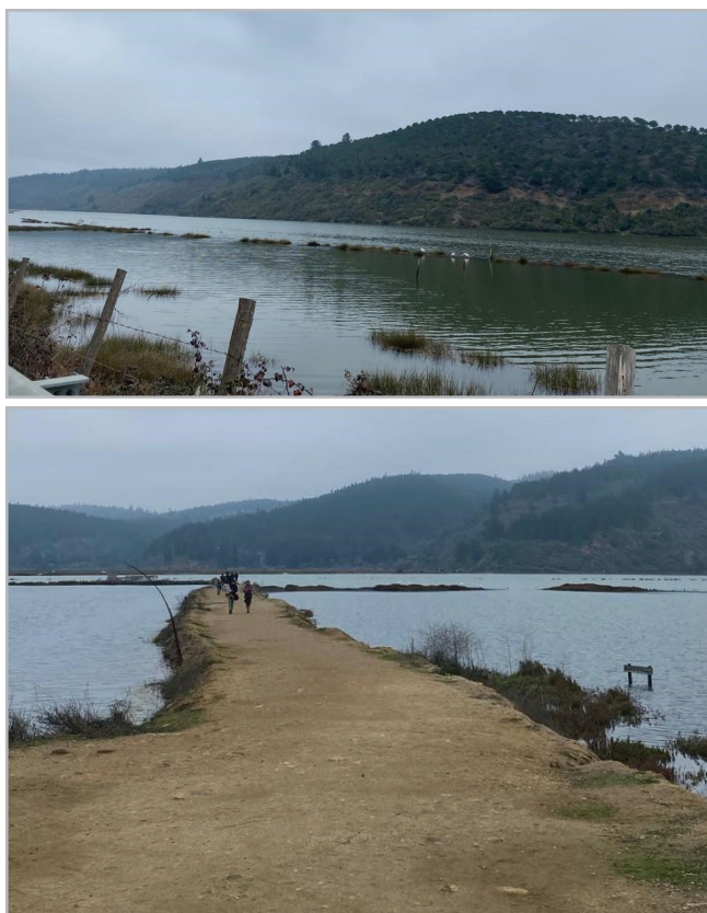
Figura 4.- Señalización de la Ruta de la Sal, parte de los programas de turismo de la zona.