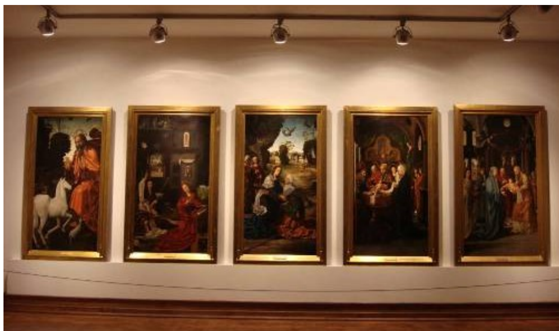
(a) (b) (c) (d) (e)

Comprovando este contexto de relações e contactos artísticos com a arte e mestres flamengos, os documentos relativos ao Contrato de obra do Retábulo-mor da Sé de Lamego do qual, actualmente, restam cinco painéis – Criação dos Animais , Anunciação , Visitação , Circuncisão e Apresentação do Menino no templo [figura 1], revelam informações desde a sua encomenda até ao assentamento, na capela-mor da Sé (Salgueiro, 2009b; Salgueiro, 2010a). Sabe-se que do primeiro contrato assinado a 7 de Maio de 1506, para o segundo contrato datado de 4 de Setembro de 1506, a encomenda lavrada entre o bispo D. João de Madureira e o mestre pintor Vasco Fernandes, comportou alterações no sentido de um reforço da monumentalidade e narrativa da obra, tendo sofrido um aumento para vinte painéis (Correia, 1924: 99-100). O programa iconográfico manteve-se entre os contratos, sendo que as alterações fundamentais ocorreram nos temas das duas pinturas centrais e os restantes dispostos em três fiadas horizontais, constituídas por seis painéis cada e com seguimento de cima para baixo, e como resultado, incluíram os temas da Criação, do Pecado e da Redenção.