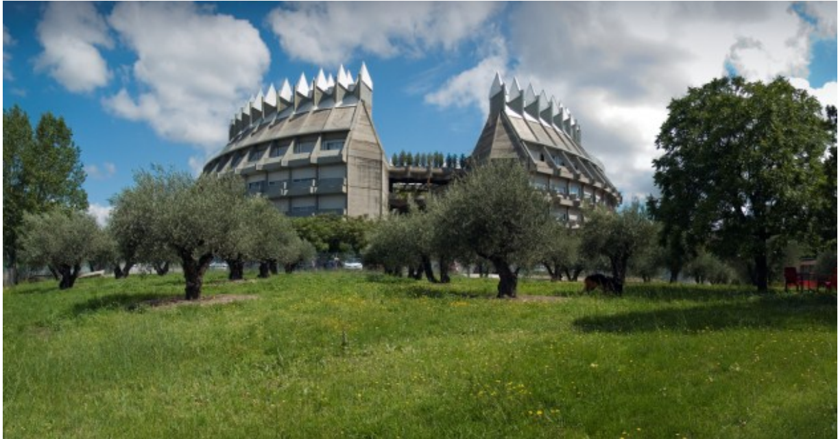
Vista panorámica del edificio del Instituto del Patrimonio Cultural de España.

Para desarrollar esta labor, el IPCE integra en su plantilla especialistas de muy diversas disciplinas: arqueólogos, arquitectos, científicos (físicos, geólogos, químicos, biólogos, etc.), conservadores, documentalistas, etnógrafos, restauradores de todas las especialidades (pintura, escultura, madera, piedra, metales, papel, tejidos, etc.), etcétera. Estos profesionales afrontan su labor de una forma multidisciplinar, mediante el trabajo en equipo y con un contenido sustancial de innovación.