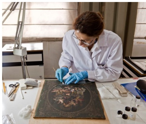
Conservación y restauración.