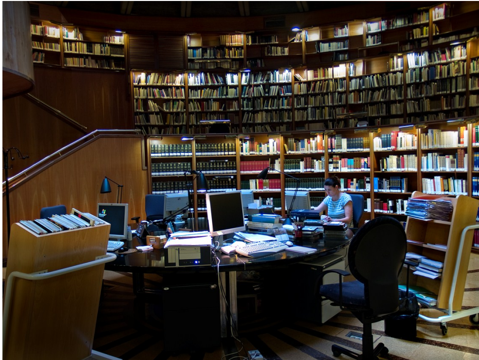
Biblioteca central del IPCE.