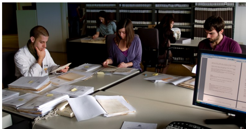
Archivo y fototeca central del IPCE. Foto Jesús Herrera (Fototeca digital del IPCE)

Si dispusiéramos las actividades del Instituto en un gráfico, ordenadas por áreas, tendríamos el siguiente pentágono o estrella, en la que la parte superior representa las actividades de intervención, las cuales generan un conocimiento que integra la parte media del gráfico. Ese conocimiento es trasladado a la sociedad a través de acciones que se encuentran en la parte inferior del diagrama. De esta forma toda la actividad del instituto responde a un concepto de gestión global del patrimonio, en el que cada actuación sobre los bienes culturales se transforma en información y conocimiento que son transferidos a la sociedad, última destinataria de nuestra labor.