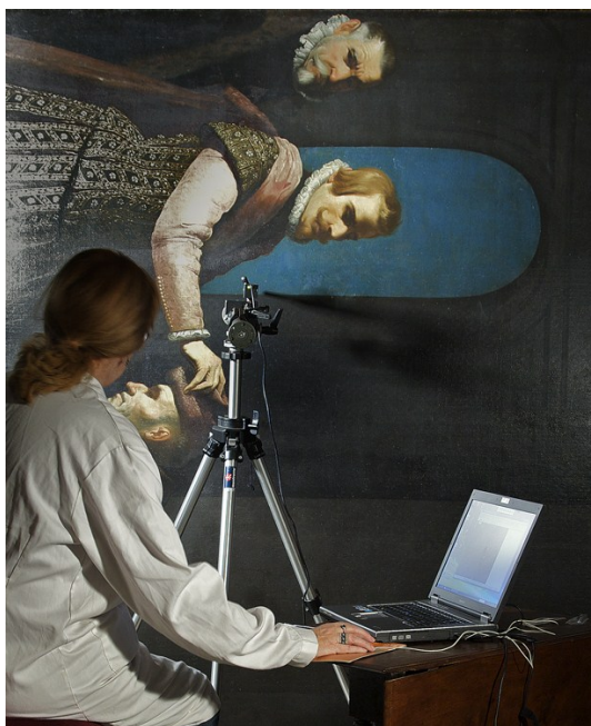
Trabajos de investigación.

El IPCE promueve también la investigación en el campo de la conservación y restauración del patrimonio, así como la de carácter histórico o científico asociada a intervenciones de restauración. Además de los análisis necesarios para las intervenciones, el IPCE desenvuelve con universidades y centros de investigación proyectos de investigación, desarrollo e innovación en criterios, métodos y técnicas de conservación y restauración. Dentro del recientemente aprobado Plan Nacional de Investigación sobre Conservación del Patrimonio Cultural, se prevé una convocatoria específica de proyectos de investigación.