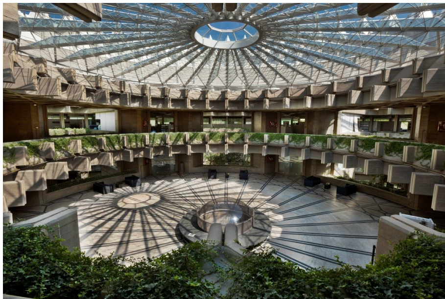
Rotonda interior del IPCE.

Inicialmente los planes se basaban casi exclusivamente en una sucesión de intervenciones de restauración, pero hoy pensamos que deben profundizar también en todos aquellos aspectos relacionados con la investigación, la documentación, la conservación preventiva y la difusión de las actuaciones realizadas y del conocimiento adquirido. Por estas razones se ha creído necesario actualizar los planes en marcha, dotándolos de herramientas de gestión que permitan un desarrollo transversal de los mismos y ejercer una adecuada gestión cultural que tenga en cuenta la proyección social y económica del Patrimonio.