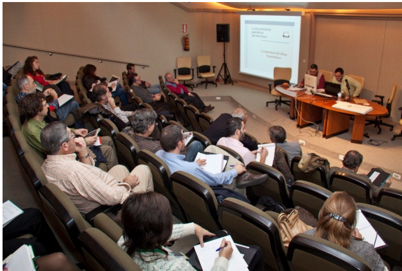
Salón de actos del IPCE.

El IPCE ofrece también becas y estancias en prácticas con el fin de completar la formación de especialistas y facilitar la inserción en el mundo laboral a profesionales de la conservación y de la gestión del patrimonio cultural.