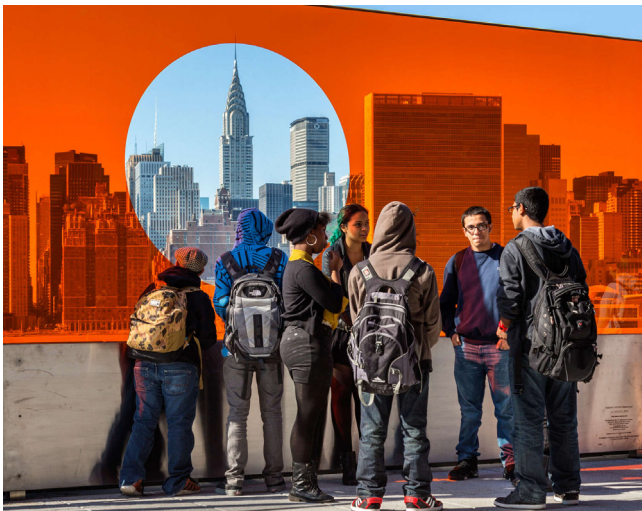
Figura 3.- Artista: Natasha Johns-Messenger; Título: Alterview ; Localización: HS/ IS 404, Hunters Point, Queen; Breve descripción: Ubicada en la azotea de un instituto público en Queens, la pieza versa sobre las diferentes percepciones de la realidad dependiendo desde donde se miren las cosas.