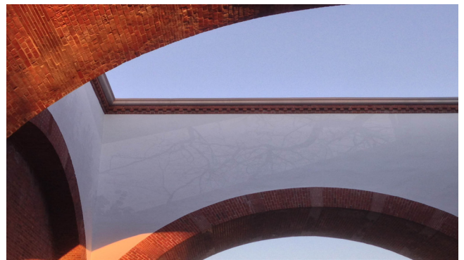
Figura 7.- Artista: Mary Temple; Título: Double Sun ; Localización: McCarren Pool, Brooklyn; Créditos de foto: Sergio Pardo López; Breve descripción: Murales que celebran con dos sutiles trampantojos a la entrada del centro deportivo la historia del barrio, los meses de verano y parte de la vegetación perdida del parque.