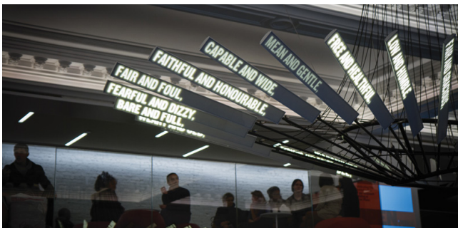
Figura 4.- Artista: Ben Rubin; Título: Shakespeare Machine ; Localización: Public Theater, Manhattan; Breve descripción: Obra que muestra una selección cambiante de frases de los textos de Shakespeare en el espacio que rinde tributo a su obra y se ha convertido en el icono del teatro público de Nueva York.