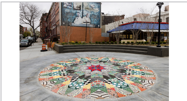
Figura 5.- Artista: Ellen Harvey; Título: Mathematical Star ; Localización: Marcy Plaza, Brooklyn; Breve descripción: Pieza de arte público que funciona en diversos niveles. Por un lado el mosaico recoge la historia del barrio a través de la tradición patchwork incorporando 18 patrones diferentes que hacen referencia a lugares de especial importancia para la comunidad, y por otro genera un nuevo hito con identidad propia. La pieza hoy en día es activada por diferentes organizaciones locales que trabajan con mujeres tras cumplir sus condenas y los hijos de están que han nacido y vivido en prisión, para fomentar sentimiento de identidad y pertenencia en su barrio.