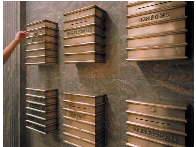
Figura 6.- Artista: Janet Zweig; Título: Your Voices ; Localización: Walton High School, Bronx; Créditos de foto: NYC Department of Cultural Affairs; Breve descripción: Obra con un componente participativo que funciona como elemento de conexión entre docentes y estudiantes en un colegio público del Bronx.