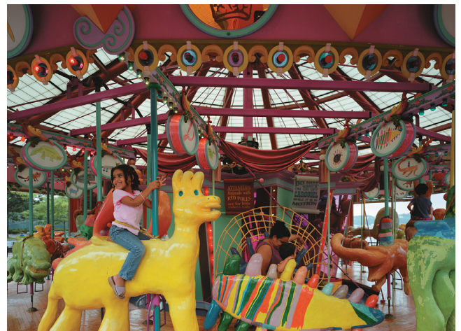
Figura 8.- Artista: Milo Mottola; Título: Totally Kid Carousel ; Localización: Riverbank State Park, Manhattan; Créditos de foto: NYC Department of Cultural Affairs. Breve descripción: Pieza creada por el artista con el propósito de revitalizar un parque en desuso y que incorpora el trabajo realizado por el artista con los niños de la zona a fin de generar un sentimiento de propiedad.