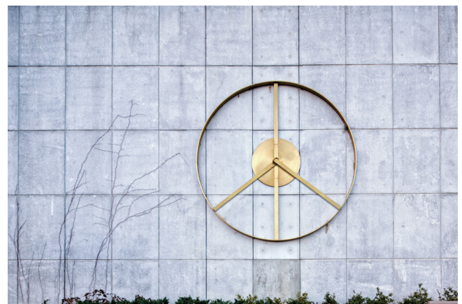
Figura 2.- Obra titulada Peace Clock , realizada en 2019 por la artista Lina Viste Grønli y ubicada en la Trygve Lie Plaza, enfrente de las Naciones Unidas en Manhattan. La pieza en su concepción busca reflexionar sobre cómo ha de abordarse el monumento contemporáneo, buscando conceptos atemporales y transversales en la diversidad de los espectadores, para una mayor relevancia en el tiempo del legado de la persona al que se busca honrar. Peace Clock es una pieza de arte público cinética ubicada delante de las Naciones Unidas que forma el símbolo de la paz dos veces al día (04:30 y 16:30) como tributo a Trygve Lie, primer Secretario General de la organización y promotor de la campaña de desarme nuclear. Concejalía de Cultura de la Ciudad de Nueva York

más fácilmente con la concepción más tradicional de "arte público", los proyectos del Percent for Art Program pretenden reflexionar con una visión contemporánea sobre la trama urbana en la que se insertan. Obras como Alterview de Natasha Johns-Messenger que versa sobre las diferentes percepciones de la realidad; Your Voices de Janet Zweig, que funciona como elemento de conexión entre docentes y estudiantes en un colegio público del Bronx; Peace Clock de la artista noruega Lina Viste Grønli, repensando la idea del monumento o memorial con su escultura cinética frente a las Naciones Unidas; o una lámpara de LED, Shakespeare Machine de Ben Rubin que se ha convertido en el icono del vestíbulo del Public Theater, constituyen ejemplos claros de lo que tratan de conseguir. [figura 2]