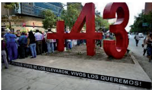
Figura 6.- Antimonumento +43, México. https://es.wikipedia.org/wiki/Antimonumento [consulta: 8/08/2020].