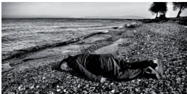
Figura 7.- A la deriva con Ai Wei Wei. https://www.duendemad.com/es/n-164-el-libro-negro-del-mar/la-deriva-con-ai-wei-wei [consulta: 15/09/2020].

De igual manera que en los siglos pasados existieron las llamadas Cámaras de las Maravillas ricas en significados y con objetos de las ciencias naturales importantes y valiosos para los hombres de Ciencias, han existido a lo largo de la Historia y en el presente otras cámaras o lugares que fueron y son silenciadas o no referenciadas. El tránsito de las Cámaras de las Maravillas [6] a las Cámaras de Exterminio es un camino actualmente insalvable. La Historia nos ha transmitido lugares interesantes creados para la conservación: archivos, gabinetes y cámaras de las maravillas, museos y bibliotecas, etc. Sin embargo, ha silenciado o no cita los lugares de destrucción. En esos lugares el ser humano, rodeado de un marco inhóspito y en peligro, conoció la tortura, un trato degradante e indigno, hasta perder su propia dignidad y humanidad. A la ausencia de cultura, al vacío cultural, no le hemos puesto nombre. [Figura 8]