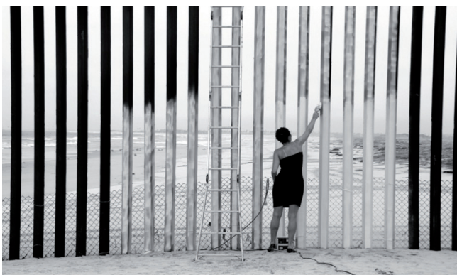
Figura 4. - “Borrando la frontera” de Ana Teresa Fernández. https://www.codigonuevo.com/entretenimiento/artista-consiguio-borrar-frontera-mexico-unidos [consulta: 8/08/2020]

— Sobre los lugares de la deshumanización de José Ortega y Gasset y de la barbarie de Tzvetan Todorov