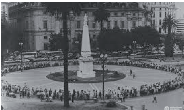
Figura 5.- Madres Plaza de Mayo. https://clate.org/noticias/a-43-anos-de-la-primera-ronda-de-madres-de-plaza-de-mayo/ [consulta: 15/09/2020].

Pongamos un caso claro de lugar de memoria lúcida, por ejemplo, las Madres de Plaza de Mayo fundada en esta plaza en 1977 como lugar de la memoria de la desaparición de 30.000 jóvenes en Argentina [15] , o el Anti-monumento +43 por los jóvenes desaparecidos de la Normal Rural de Ayotzinapa colocado en el año 2015 en la Avenida Paseo de la Reforma de Acapulco (México) [16] [Figuras 5 y 6]