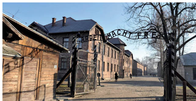
Figura 1.- La entrada a Auschwitz. http://historia.nationalgeographic.com.es/a/27-enero-dia-internacional-conmemoracion-victimas-holocausto_12309/6 [consulta: 15/09/2020].

podrían sumarse bien en la misma lista o en la otra: Mauthausen, Dachau, Sachsenhausen, Ravensbrück. Buchenwald, entre otros. Pero también otros campos actuales y contemporáneos. [figuras 1 y 2].